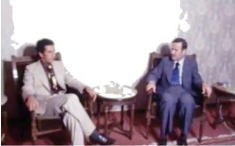
لقاء بين عبد السلام جلود وحافظ الأسد في دمشق، ضمن مساعي جلود لرأب الصدع وتقريب وجهات النظر بشأن الحرب الأهلية في لبنان، سورية، 13/7/1976.